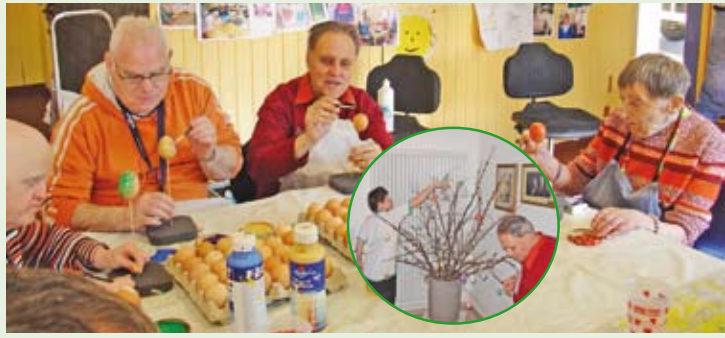
Ostern, vor dem Fest ist konzentrierte, künstlerische Tätigkeit unumgänglich. Wollen doch die 60 ausgeblasenen Eier aus der Küche schön verziert werden. Nach dem Trocknen wurden diese dann traditionell an die Ostersträube gehängt.