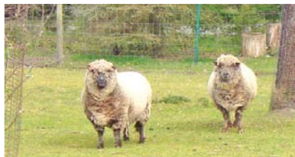
Während der Apfelernte verstecken sich die Schafe, so man sieht es.