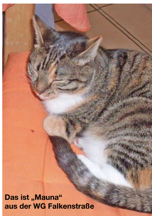
Das ist „Mauna“ aus der WG Falkenstraße