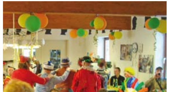
Hier fliegen gleich die Löcher aus dem Käse..... 🎵