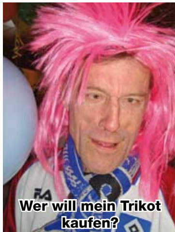
Wer will mein Trikot kaufen?