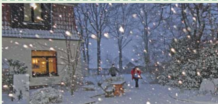
Erinnern Sie sich noch? Ein langer Winter, viel Schnee und hier die „Petersburger Schlittenfahrt“.